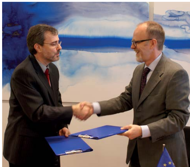
Memorandum o soglasju ECHA-Kanada je bil podpisan leta 2010.

Države EU in EGP, ki so sprejele uredbe REACH in CLP ter države upravičenke do instrumenta predpristopne pomoči (IPA) in evropske sosedstva politike (ESP).