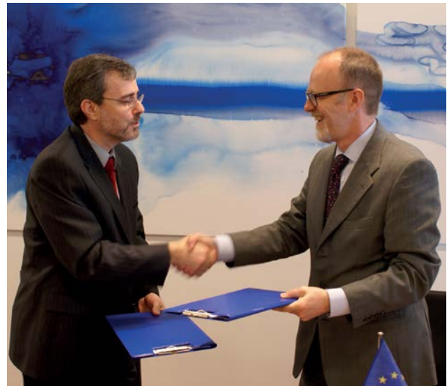
Il Memorandum d'intesa dell'ECHA con l'Australia è stato firmato nel 2010.

La prima politica riguarda i paesi candidati e i candidati potenziali per l'adesione all'UE, la PEV è rivolta a 16 paesi immediatamente ubicati alle frontiere esterne dell'Unione. L'ECHA ha contribuito a entrambi i settori delle politiche di ravvicinamento, applicazione e attuazione delle normative dell'Unione europea.