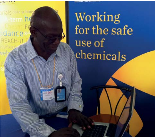
Un partecipante all'incontro ICCM-3 studia il sito web dell'ECHA presso lo stand informativo dell'Agenzia a Nairobi.